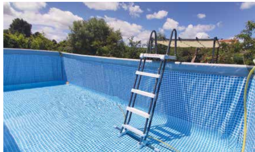
Polnjenje domačega bazena

Med opisanimi možnostmi Mariborski vodovod priporoča polnjenje hišnih bazenov iz domačega hišnega priključka , po koncu polnjenja pa naj uporabnik sporoči stanje vodomera podjetju – oddelku obračuna vode.