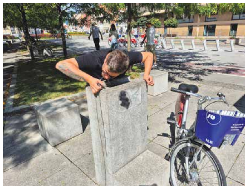
sprehajajo po mestu, parkih in rekreacijskih poteh.

Pomembno je poudariti, da številni pitniki niso namenjeni le ljudem, temveč so prilagojeni tudi za napajanje hišnih ljubljencev. To je še posebno dobrodošlo za lastnike psov, ki se poleti