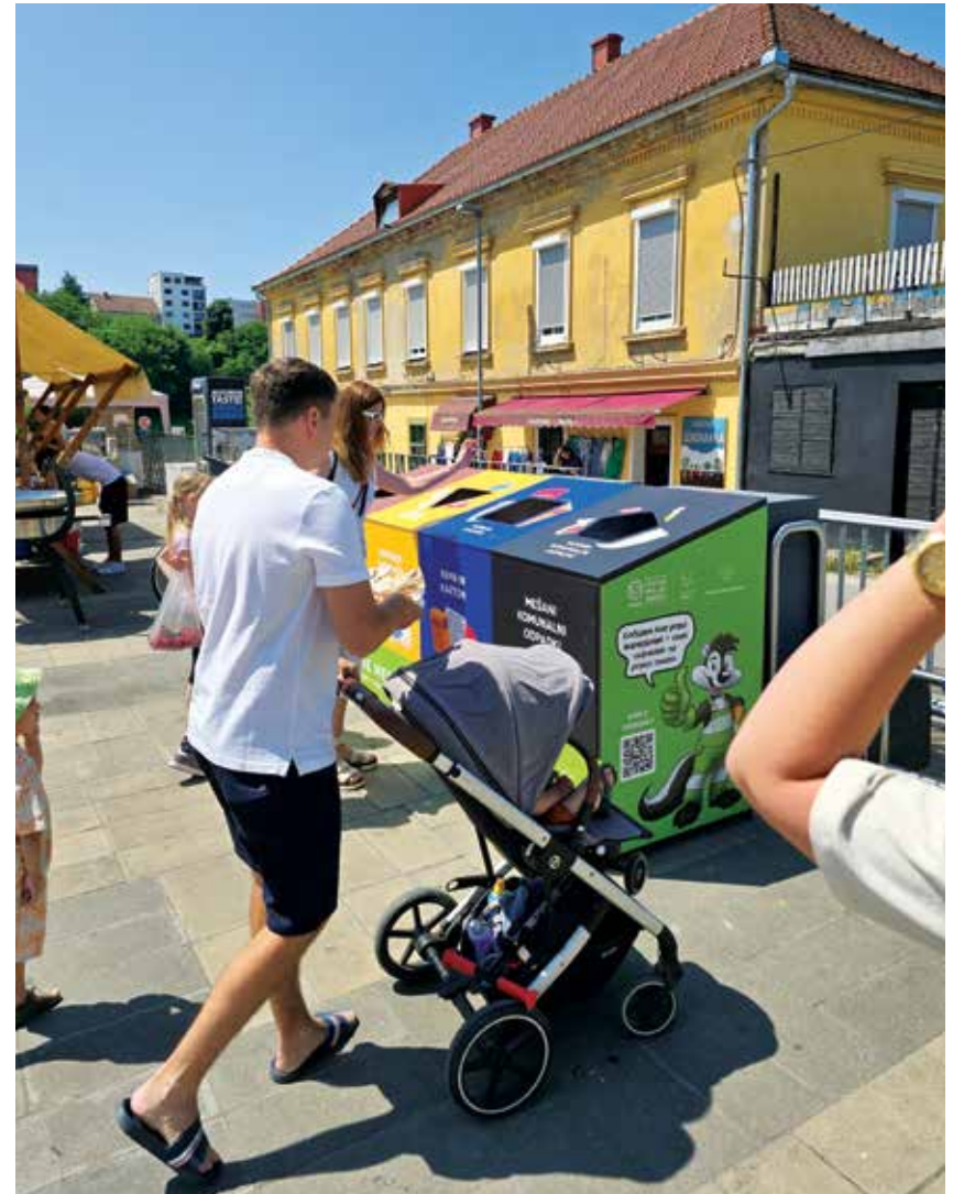
Urbani ekološki otok na Čagi okusov – tržnica Maribor

Ločevanje odpadkov ni več le priporočilo – postalo je osnovna državljanska dolžnost. Vsak posameznik ima v rokah