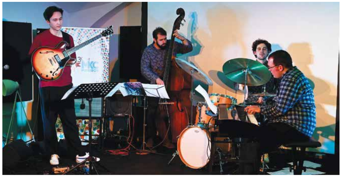
Jazz 'ma mlade

Maribor s tem nazivom ni prepoznan le kot prostovoljstvu prijazna občina, temveč kot skupnost ljudi, ki se zavedajo pomena medsebojne pomoči. Prostovoljci puščajo neizbrisne sledi – ne le v statistikah in poročilih, temveč v srcih tistih, ki jih dosežejo.