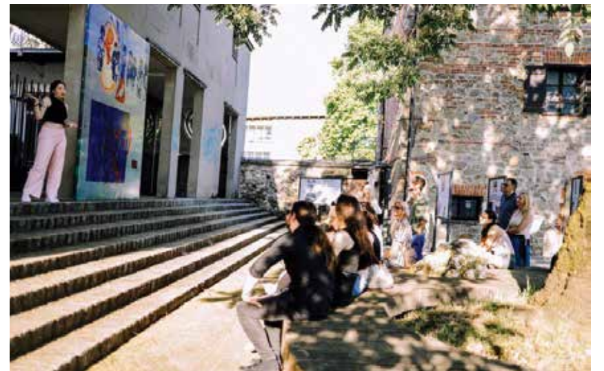
Dogajanje pred mladimi arkadami

MKC tudi letos ponuja pomembno podporo mladim, ki se soočajo s prekarnostjo. Individualna svetovanja in informiranja bodo potekala vsak torek med 12. in 14. uro. Poleg tega 19. in 20. 8. pripravljajo tudi posebno usposabljanje Skupaj proti prekarnosti mladim , namenjeno opolnomočenju in plovovanju. Kulturno-umetniški utrip bodo