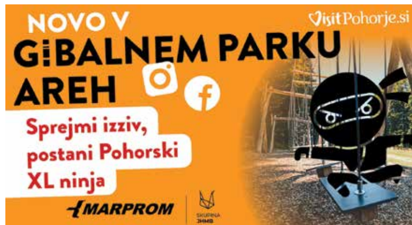
Skills park

skiXLninja. Vsak mesec bo video z največ všečki prejel privlačno mesečno nagrado, kot je vozovnica za gorske trikolesnike ali Bike park Pohorje Maribor. Videi, ki bodo dosegli več kot 100 všečkov, pa bodo uvrščeni v zaključno žrebanje za glavno nagrado – letno vozovnico XL.