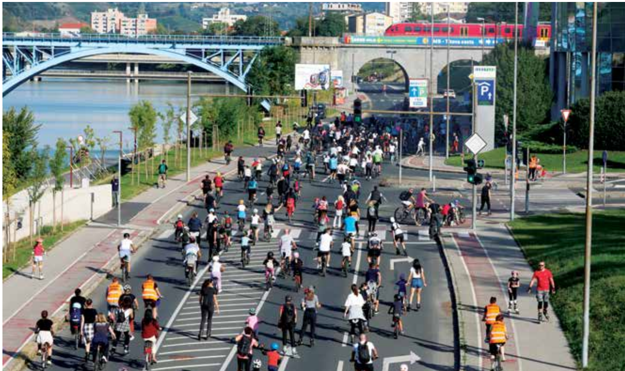
Zzrolano mesto 2024

Evropski teden mobilnosti je tudi priložnost za preizkušanje inovativnih ukrepov celostnega prometnega načrtovanja prostora, uvajanje nove infrastrukture za trajnostno mobilnost ter izboljšanje