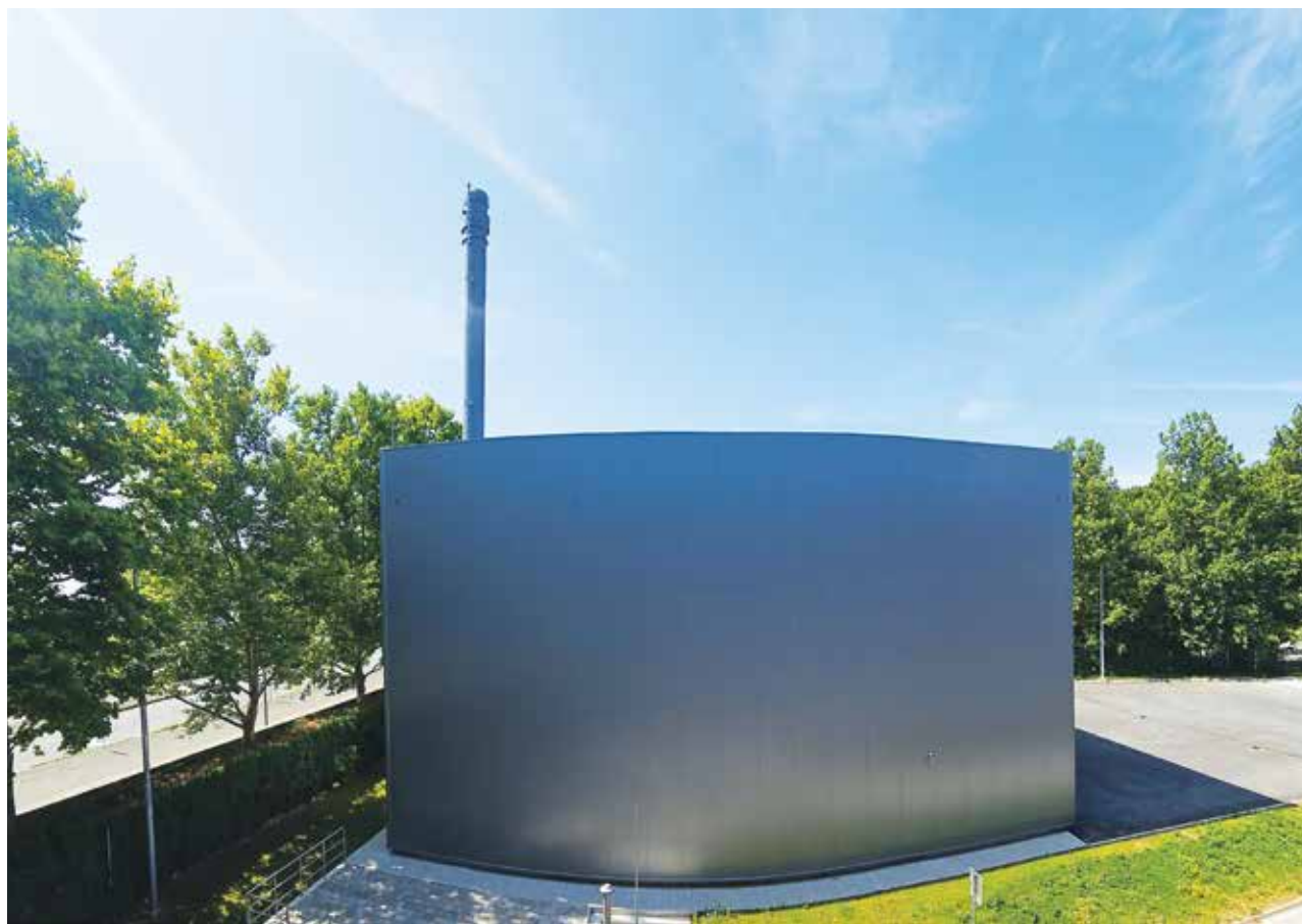
Simbolična fotografija – energijska izraba lesne biomase v Mariboru

Zavedajoč se občutljivosti teme, se bo Energetika Maribor v sodelovanju z Javnim holdingom Maribor in Mestno