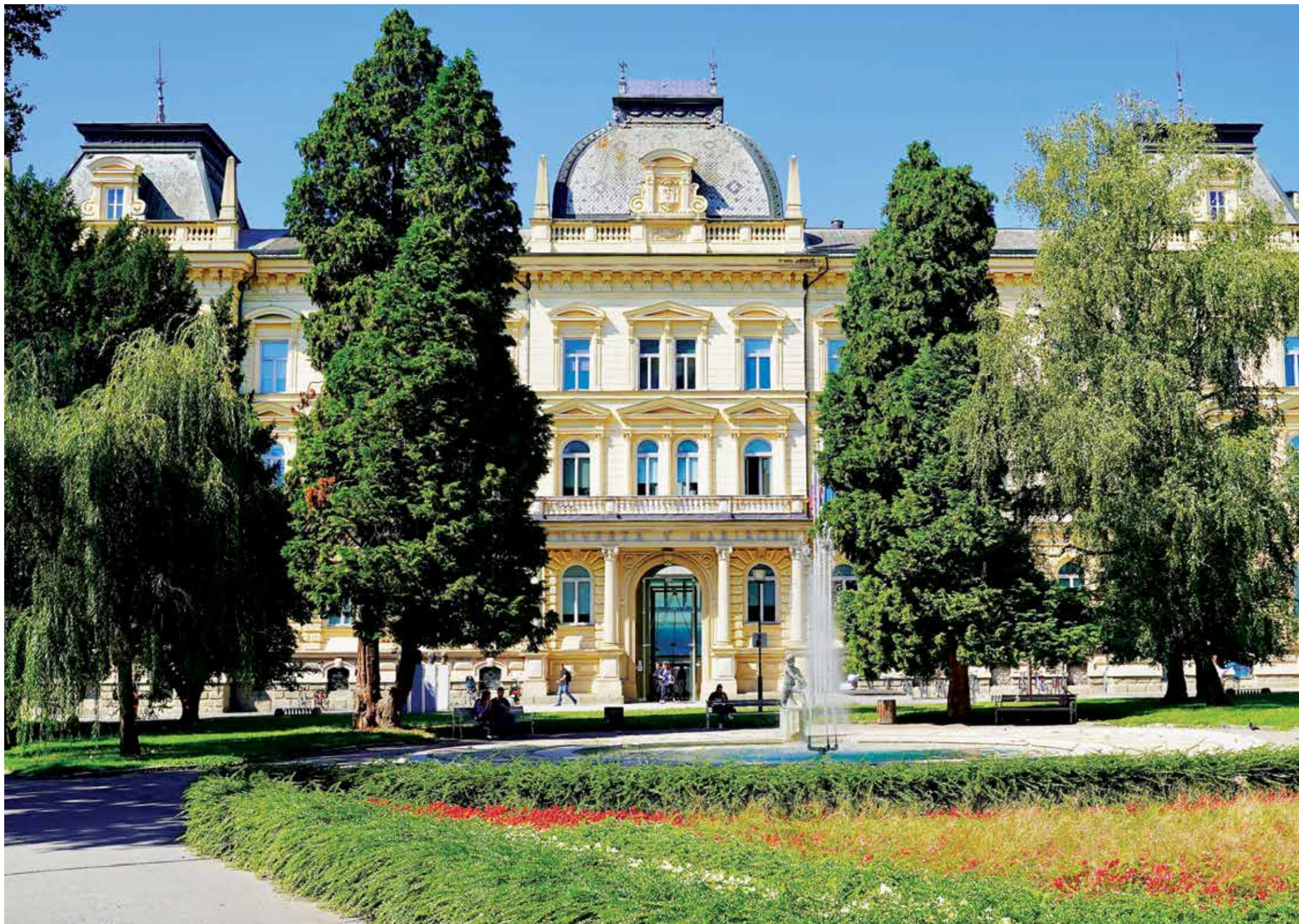
Rektorat Univerze v Mariboru