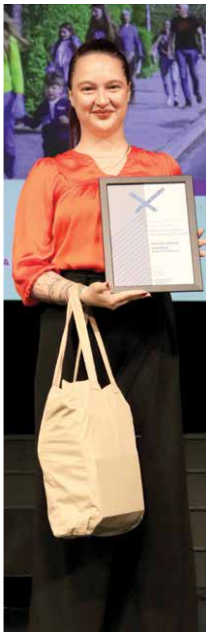
Predstavnica MO Maribor prevzema priznanje Prostovoljstvu prijazna občina 2025.

Lani je občina finančno podprla več kot 150 prostovoljskih organizacij s področij civilne zaščite in reševanja, kulture in umetnosti, vzgoje