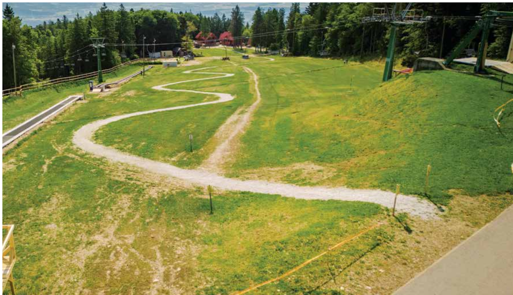
Proga za gorske trikolesnike

Outdoor centra Bolfenk in Areh ponujata širok spekter adrenalinskih aktivnosti za vse generacije; v Outdoor centru Bolfenk so na voljo spusti z gorskimi trikolesniki po progi Sleme, zorbing nogomet in kmalu še zorbing adrenalina . Medtem za najmlajše pripravljamo mini skills park pri zgornji postaji Pohorske vzpenjače, kjer se bodo otroci lahko učili osnovnih veščin za vožnjo MTB (mountain bike).